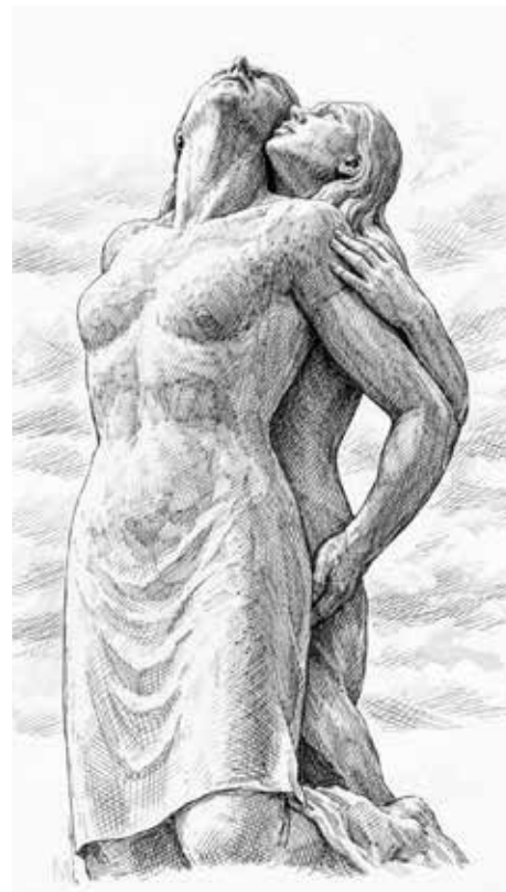
Rappresentazione grafica della statua della Madre ciociara

Le due campane condividono un'origine simbolica simile. Maria Dolens raccoglie nel suo bronzo le armi che avevano devastato l'Europa, la campana di Castro dei Volsci porta con sé le lingue dei popoli — italiano, inglese, francese, tedesco, ebraico, russo, cinese, giapponese — come se il suo manto volesse tradurre la memoria in un linguaggio universale. In entrambi i casi quella lega metallica non è soltanto materia, ma è diventata parola pubblica.