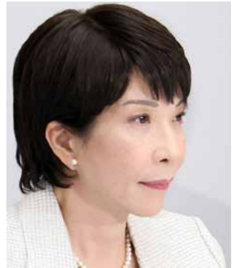
La Premier giapponese Sanae Takaichi

Come riconosciuto da una pluralità di commentatori, per poter trasformare l'attuale "luna di miele" con l'elettorato nazionale in un "matrimonio consolidato", occorrerà che la signora Takaichi si impegni rapidamente ad affrontare, e positivamente risolvere, alcuni delicati dossier da tempo pendenti.